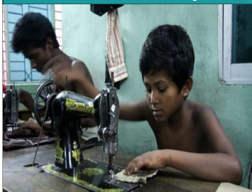
Défense de jouer Exposition

Cette exposition permet de découvrir le travail des enfants, hier en Belgique et aujourd'hui dans le Monde. Visites guidées et animations sur rdv, pour groupes accompagnés.