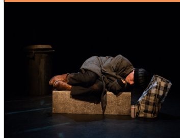
Le moment clé Comédie jeune public (1h) Compagnie du chien qui tousse

Sensibilité, humour et dimension fantastique sont les maîtres mots pour aborder les thèmes de la pauvreté, de la solidarité et de la responsabilité collective face aux moments de fragilité. Le présent croise le passé et révèle le caractère précieux de la vie.