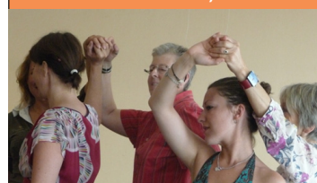
Projet du Plan Cohésion Sociale de Rochefort (PCS)

2 journées en novembre (dates à confirmer)