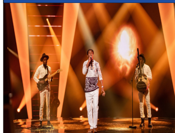
La pauvreté et les droits des enfants de l'autre côté du monde 18h

Rencontre avec l'ONG Village Pilote, au Sénégal, travaillant avec les enfants des rues