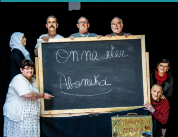
On na éter abonékol Théâtre action (40 min)

Une création collective de la Cie Buissonnière et du collectif « Les Transfor'Acteurs ». Un spectacle qui dénonce les inégalités à l'école et livre ce message : « Nous ne voulons pas que les enfants qui sont à l'école aujourd'hui soient analphabètes demain ».