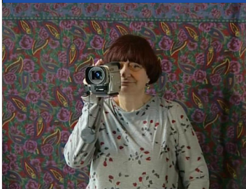
Les glaneurs et la glaneuse Cinéma documentaire Agnès Varda - 2000 - 82'

Un peu partout en France, Agnès a rencontré des glaneurs et glaneuses, récupérateurs, ramasseurs et trouvailleurs. Par nécessité, hasard ou choix, ils sont en contact avec les restes des autres. Leur univers est surprenant. On est loin des glaneuses d'autrefois qui ramassaient les épis de blé après la moisson. Patates, pommes et autres nourritures jetées, objets sans maître et pendule sans aiguilles, c'est la glanure de notre temps.